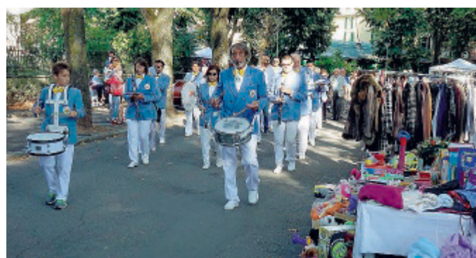
Parco Mazzini L'esibizione della banda di Salsomaggiore.