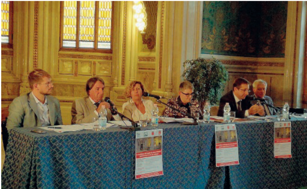
Terme Berzieri Il tavolo dei relatori all'incontro di ieri pomeriggio.

«L'obiettivo della nuova legge è di riqualificare il settore termale - hanno affermato - a partire da un fondo di 20 milioni per sostenere progetti che prevedano una struttura termale inserita in un contesto di cui devono far parte gli aspetti turistici e culturali di un territorio. Le terme viste come